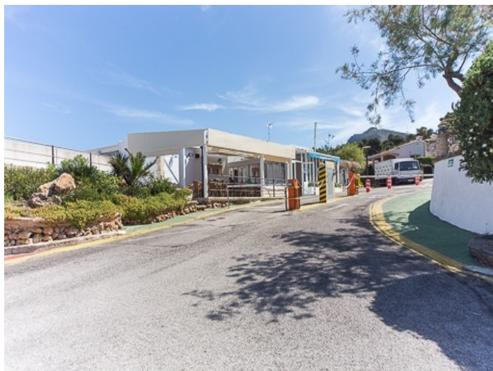
Access to the urbanization