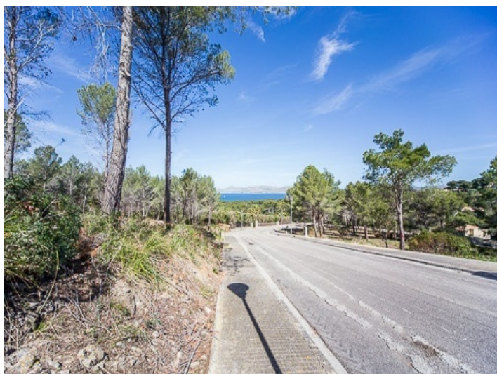
Building plot of 1000 sqm