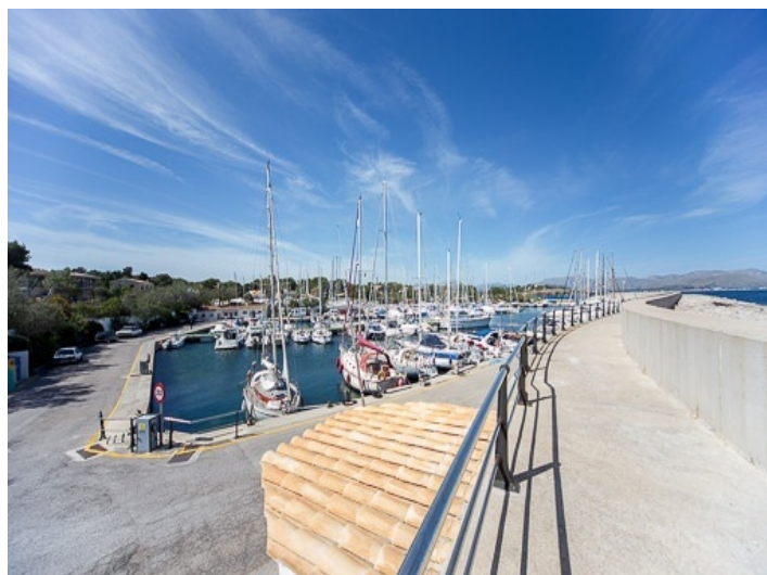
Views of the harbour

All information is correct to the best of our knowledge. Errors and prior sale excepted. This prospectus is purely for information purposes. Only the notarized deed of sale is legally binding.