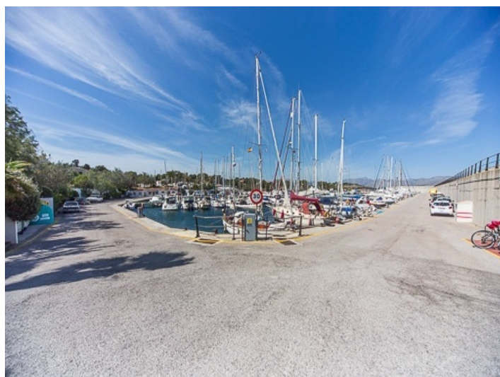
Harbour of Bonaire nearby