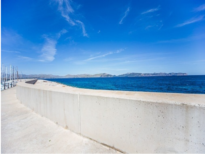
Nearby the sea