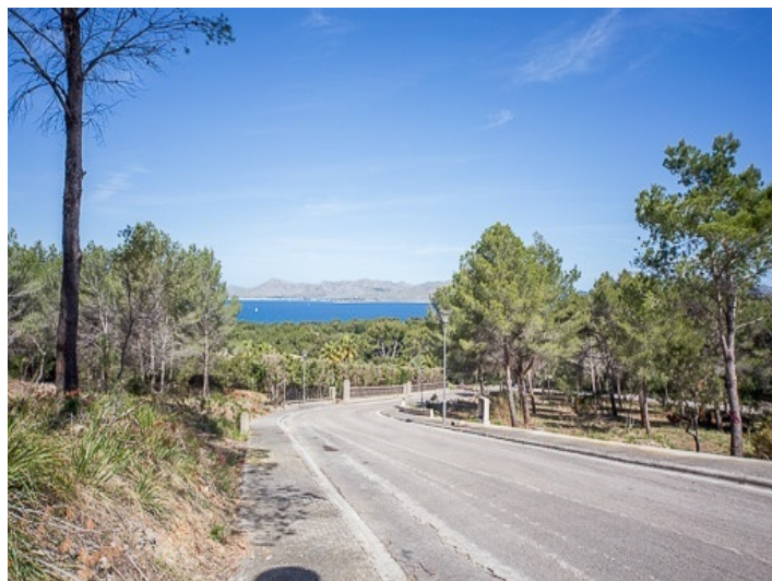
Elevated plot with nice sea views