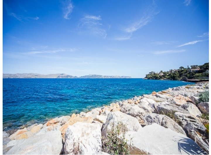
Fantastic location near the sea